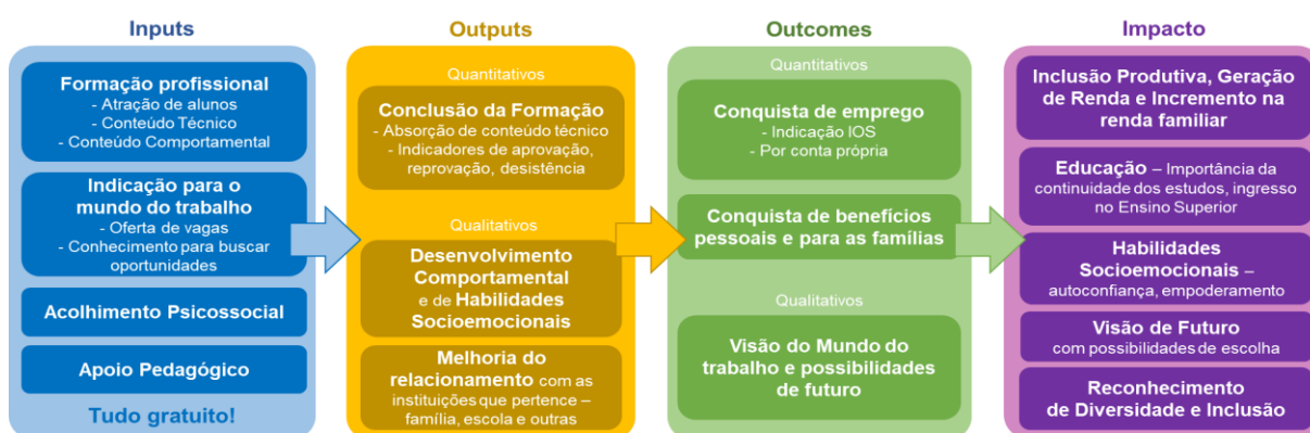
Figura 2: Caminhos para o impacto