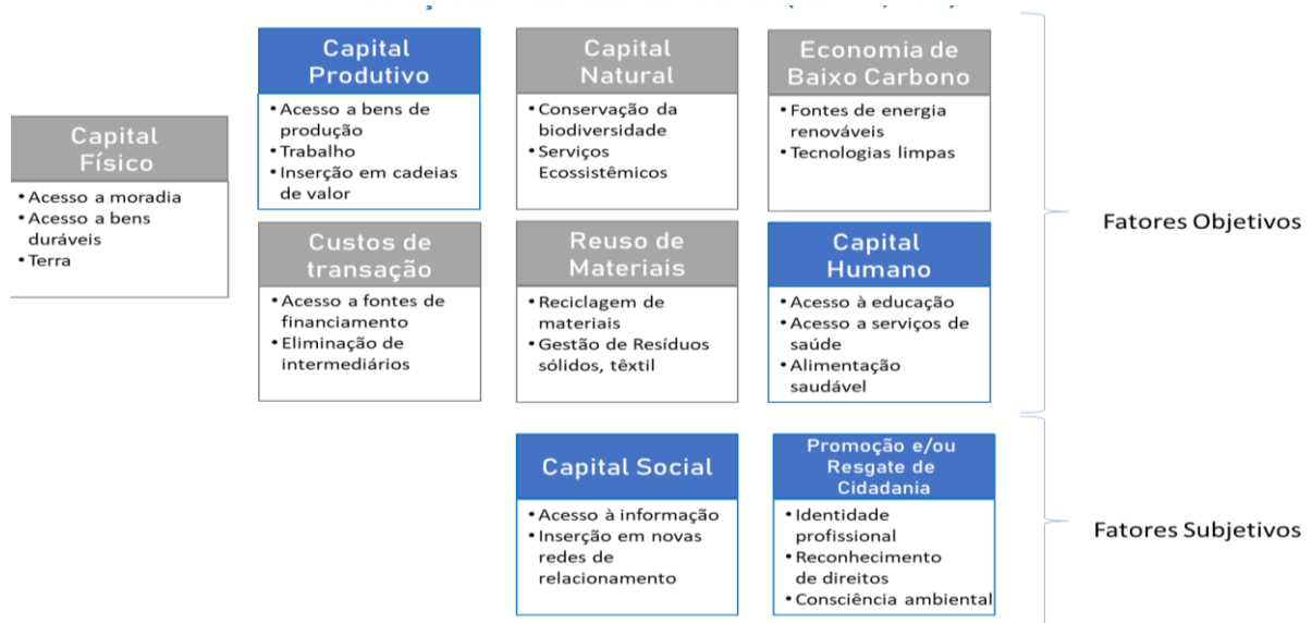
Figura 1: Categorias da geração de valor socioambiental