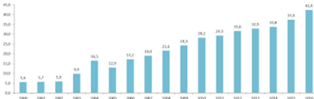
Gráfico 1: Evolução das mulheres privadas de liberdade (em mil) entre 2000 e 2016

Fonte: Ministério da Justiça. A partir de 2005, dados do Infopen. Dados consolidados para a série histórica