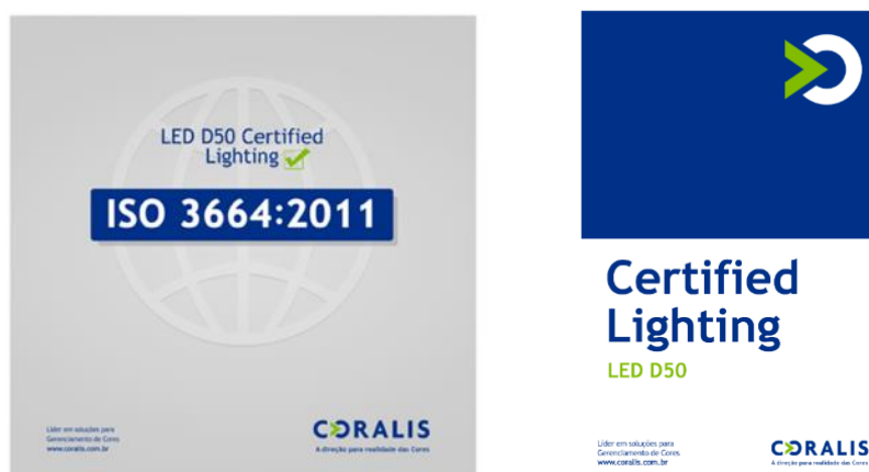
Figura 5 – Selos de aprovação de iluminação em salas de inspeção, segundo a norma NBR ISO 3664:2011.

O selo de qualidade, apresentado na figura 5 juntamente com a medição da qualidade da iluminação, foi instalado por solicitação do cliente, o que caracteriza uma inovação adaptativa “ ad hoc ” para apresentar uma solução em conformidade com normas internacionais, que garanta a qualidade da iluminação nas salas de reunião e inspeção final dos produtos. Pelo diferencial resultante, essa inovação em serviços proporciona vantagem competitiva para os clientes da empresa.