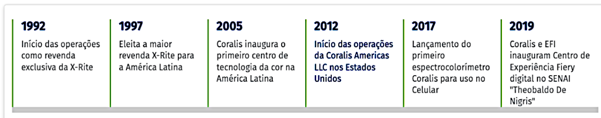
Figura 1. Linha do tempo

Conforme se observa na linha do tempo apresentada na Figura 1, em 2019 ocorre o lançamento, em conjunto com a EFI ( Electronics for Imaging ) e o SENAI, o primeiro centro de experiência profissional para impressão digital, na maior escola gráfica da América Latina, Escola SENAI Theobaldo De Nigris, localizada no bairro da Mooca, São Paulo, dedicado à formação de profissionais para a indústria de impressão digital. Essa parceria se alinha à missão de compartilhar conhecimento e capacitar pessoas para o futuro da indústria brasileira.