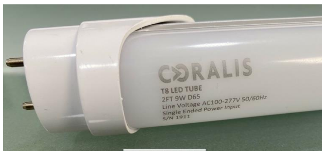
Figura 6. Lâmpada LED Coralís D65 – Novos Mercados

O plano de ações continua em implementação para a execução deste projeto. Paralelamente à execução dessa primeira fase de implementação, já se iniciou a divulgação da solução a outros setores de atividade, ampliando a abrangência do negócio pelo atendimento a novos mercados que apresentam demandas semelhantes, tais como, o fotográfico, cosmético, tintas, têxtil, plástico, dentre outros. A Figura 6 apresenta a foto da nova lâmpada para o projeto da indústria automotiva, têxtil, plástico e cosméticos.