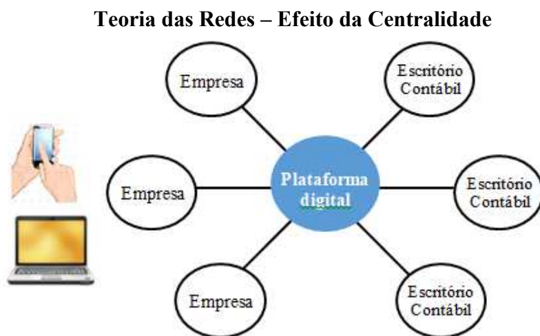
Figura 3: Teoria das Redes – Efeito da Centralidade

Fonte: Extraído de Sacomano (2004 p.54) Adaptado pelo autor.