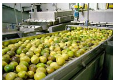
Esteira de lavação de frutas.