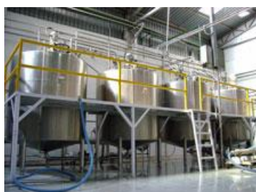
Tanques de blendagem.