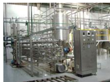
Pasteurização e Esterilização.