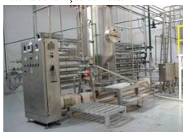
Pasteurização e Esterilização.