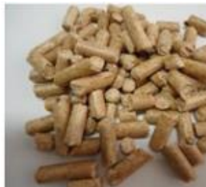
Figura 4: Pellets