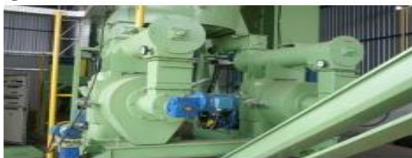
Figura 3: Peletizadora

O estudo do processo eco-inovativo com vistas a agregar valor econômico e ambiental aos resíduos industriais baseou-se em dados reais, disponibilizados pela agroindústria Beta. O estudo abrangeu o cenário específico de processamento da manga e a utilização de maquinário específico para peletização de biomassa.