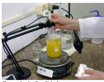
Controle de Qualidade.