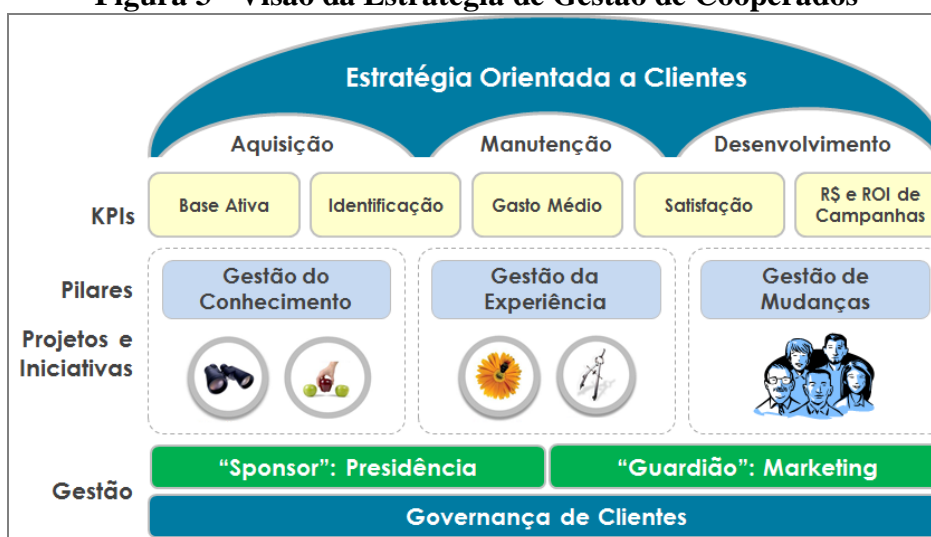
Figura 3 - Visão da Estratégia de Gestão de Cooperados

Para alcançar as metas propostas, a integração e envolvimento entre todas as áreas da Cooperativa foram fundamentais. Por esse motivo, a Coop implantou um comitê executivo quinzenal, chamado internamente de Comitê de Governança de Clientes (CGC), patrocinado pela Presidência, conduzido pelo Marketing e participação de todas as áreas, para monitoria de KPIs - indicadores de desempenho (base de clientes, identificação das compras, gasto médio, índice de satisfação, receita e ROI de campanhas), e avaliação das iniciativas e projetos de gestão do conhecimento, gestão da experiência e gestão de mudanças (Figura 3).